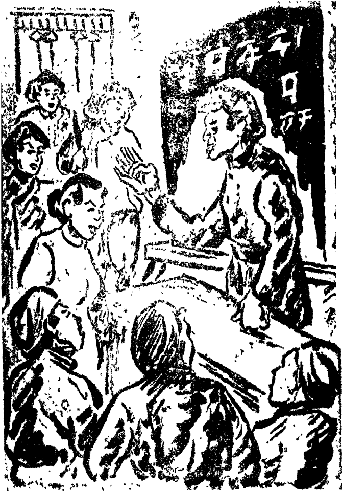
ಹಾಕಿ ಚಾಲಕಳಲ್ಲಿ ಉಯ್ಯಾಂಗನು ವರ್ಗವಿಭಜನೆಯ ರೀತಿ-ಉದ್ದೇಶಗಳನ್ನು ನಿವರಿಸಿದನು